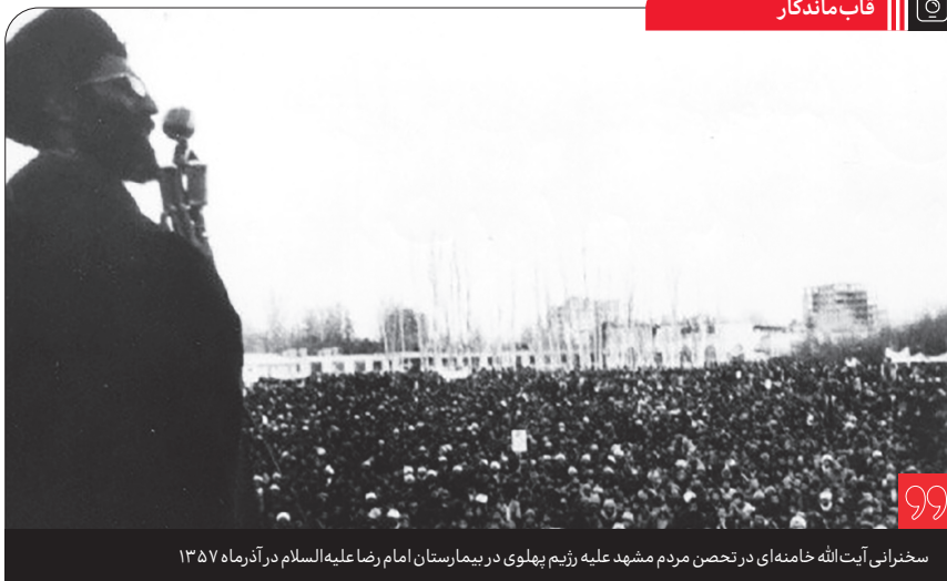
سخنرانی آیت‌الله خامنه‌ای در تخصص مردم مشهد علیه رژیم پهلوی در بیمارستان امام رضا علیه السلام در آذرماه ۱۳۵۷