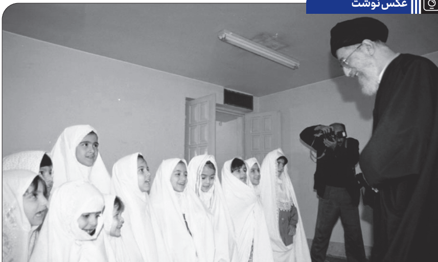
برگزاری مراسم اختتامیه شانزدهمین دوره مسابقات بین‌المللی قرآن در حضور رهبر انقلاب، ۱۳۷۸/۸/۲۰