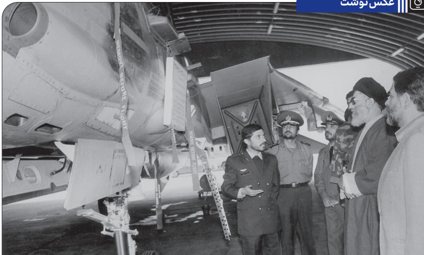
بازدید فرمانده کل قوا از پایگاه هشتم نیروی هوایی شهید بابایی، ۱۳۷۱/۷/۱۸