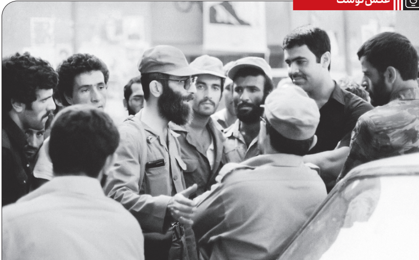
حضور آیت الله خامنه‌ای در میان رزمندگان در جبهه‌های جنگ تحمیلی